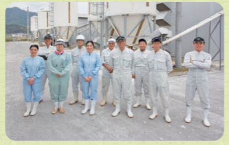
令和5年7月発行(季刊)※本誌の無断転載を禁じます

卵の価格が高騰している中、破卵率の改善は大きな課題だと思います。今号取り上げましたロボエッグについて、是非お近くのくみあい飼料株式会社へお問い合わせください! 取材させていただいたJAえひめフレッシュフーズ株式会社と西日本くみあい飼料株式会社の皆さま、ありがとうございました!